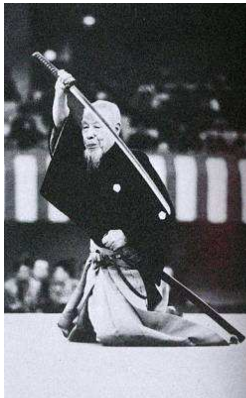
TSUMAKI SEIRIN MONTONOBU SOKE, 14ème GRAND MAITRE TAMIYA RYU IAIJUTSU