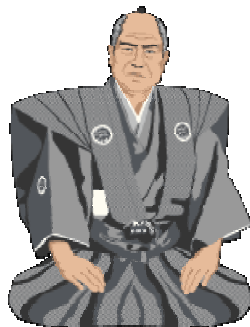
SENSEI NI, REI

Enfin le tranchant redoutable du Katana fait qu'il est aisé de se blesser en le manipulant . L'étiquette est alors un moyen d'appliquer de façon automatique un certain nombre de consignes de sécurité.